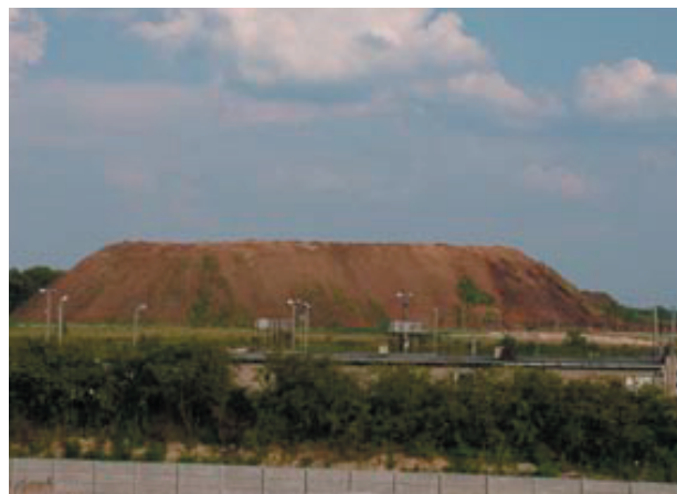
Odkąd zaczęły się protesty, hałda stała się obiektem tajemnym

Jeszcze przed rokiem 1995 odpady poprodukcyjne były nielegalnie wywożone. Po interwencji wojewódzkiego inspektoratu ochrony środowiska odpady przestano składować poza terenem zakładu, tworząc – początkowo bez jakichkolwiek uzgodnień – olbrzymią hałdę odpadów. Hałda ma wysokość ok. 15 m, zajmuje powierzchnię blisko 4 ha i znajduje się na terenie zakładu o wysokości 150 m n.p.m.”.