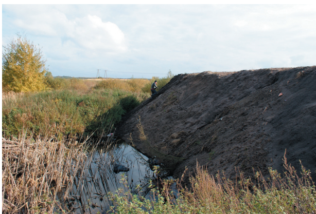
Zасыpywane oczka wodne przy ul. Leśnej

Zgodnie z dyrektywą Parlamentu Europejskiego i Rady w sprawie jakości powietrza i czystszej powietrza dla Europy (2008/50/WE) każde z państw Wspólnoty musi informować o poziomie zanieczyszczeń.